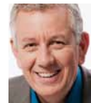
Röbi Koller Moderator beim Schweizer Radio und Fernsehen